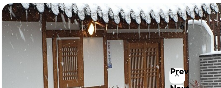
( http://www.mokpo.go.kr )

친구, 연인, 가족과 함께 아름세 한옥에서 행복한 여행과 작은 한옥이 아름답다는 잊지 못할 추억을 만드세요