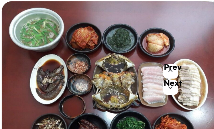
( http://www.mokpo.go.kr )

◆ 소개글 '인동초 평화주와 꽃게장의 맛있는 만남' 인동초 발효주 및 제조방법으로 신지식인으로까지 선정된 경력이 있는 인동주 마을은 인동주 막걸리와 인동초 평화주뿐만이 아니라 꽃게장 백반으로도 매우유명한 곳입니다.