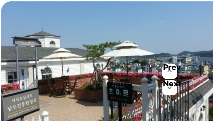
( http://www.mokpo.go.kr )

목포 유달산 자락에 자리 잡은 남도전통한정식 전문점입니다. 목포시내와 목포항이 내려다 보이는 초록빛 언덕에 자리 잡은 하얀 2층 건물이 산뜻한 느낌이 드는 곳입니다. 목포5미인 흥어삼합, 산낙지, 갈치, 꽃게무침을 비롯해 칠절판, 해물신선로, 코다리, 육회, 생선회, 전복, 소갈비찜, 낙지호롱, 초무침, 찜류, 조림류 등등 다양한 남도식 한정식을 만나실 수가 있습니다. 1대에는 백반집으로 2대에 한옥에서 재건축을 통하여 3대째까지 한정식집으로 이어져 오고 있습니다. 목포의 명당이기에 상견례와 돌잔치, 회갑, 칠순등의 중요모임을 많이 하는 곳입니다. 지정서로는 목포시가 지정한 목포시 표창패, 모범음식점, 자율가격인하업소 착한가게와 전라남도가 지정한 남도음식명가, 남도음식별미집, 월드위생업소, 중국인관 광객업소 그리고 F1지정업소의 타이틀이 있습니다. 방송노출은 MBC, KBS, SBS에서 방송되었으며 유명인사와 연예인 분들께서 다수 방문하여 주셨습니다. 봄에는 형형색색의 꽃들과 향기로 여름에는 푸르름과 시원한 전경으로 가을에는 단풍과 낙엽으로 겨울에는 아름다운 설경으로 고객님을 맞이합니다. 언제든지 방문하여 주시면 최선을 다하여 정성껏 모시겠습니다. 감사합니다.