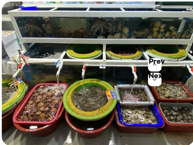
( http://www.mokpo.go.kr )

목포시 활어 위단장 27번 등매인을 겸하고 있어서 매일 싱싱하고 다양한 자연산 활어회를 맛볼 수 있습니다. 특히, 여름철에는 살아 있는 활민어를 먹을 수 있으며, 세발낙지는 일년 내내 구비되어 있어 언제든지 드실 수 있습니다. 목항 횡집 22년의 경영 경험으로 깨끗하고 신선한 회를 제공합니다. 계절마다 메뉴가 바뀔 수 있습니다.