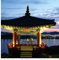
동그라미 목포 하루 여행

낙조대 > 유달산 노적봉 > 이훈동정원 > 목포근대역사관 2관 > 목포진 > 김대중노벨평화상기념관 > 이난영공원 > 독천식당 코스 자세히 보기