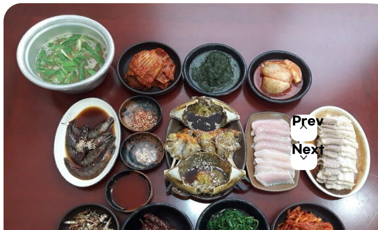
( http://www.mokpo.go.kr )

◆ 소개글 '인동초 평화주와 꽃게장의 맛있는 만남' 인동초 발효주 및 제조방법으로 신지식인으로까지 선정된 경력이 있는 인동주 마을은 인동주 막걸리와 인동초 평화주뿐만이 아니라 꽃게장 백반으로도 매우유명한 곳입니다.