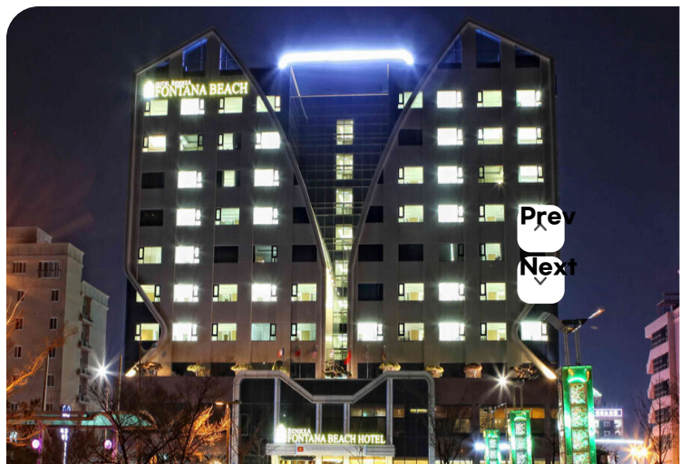
( http://www.mokpo.go.kr )

저희 폰타나비치호텔은 지하 1층, 지상 10층 규모로 67개의 객실과 연회장, 세미나실, 비즈니스 센터, 사우나, 레스토랑, 일식당 등의 부대시설을 갖추고 있는 3성급 관광호텔입니다. 전 객실에서 지중해처럼 탁 트인 바다와 함께 목포의 명물 '출추는 바다분수'의 환상적인 쇼를 관람할 수 있으며, 카페트 대신 온돌마루로 이루어진 객실 바닥과 온돌 난방, 친환경 소재 내부 인테리어, 천연라텍스 침대와 100% 거위털 침구류는 고객님의 미세먼지가 없는 보다 쾌적하고 안락한 잠자리를 제공 할 것입니다. 최고의 시설과 더불어 저희 호텔 모든 임직원들은 고객님의 편안한 휴식과 아름다운 추억을 담아가실 수 있도록 고객 한 분 한 분께 정성 어린 서비스로 모실 것을 약속드립니다.