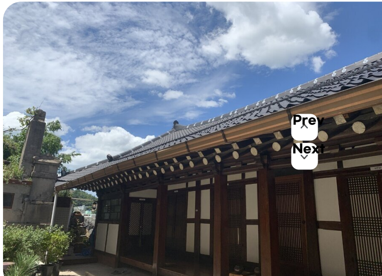
( http://www.mokpo.go.kr )

시간을 흥내낸 곳은 많지만 시간을 간직한 곳은 거의 없습니다. 목포 호텔목화는 약 330년된 조선시대 장산도 원님 사랑채 한옥과 1960년대에 지어진 근대 양옥 여관이 공존하는 곳입니다. 목포에 현존하는 가장 오래되고 규모가 컸던 곳이기도 이승만, 윤보선, 박정희, 김대중 등 역대 대통령들이 묵은 숙소로도 알려져 있습니다. 독산 위에 위치하여 목포항 바다부터 근대역사거리, 유달산, 고하도까지 목포 시내 전체가 내려다보이는 독보적인 뷰를 지닌 곳입니다. 호텔목화에서 타임머신을 타고 그 시간의 발자취를 느껴보시기 바랍니다. 양옥 일반실/ 양옥 오션뷰일반실/양옥 대통령실/양옥 가족실/양옥 스위트룸/한옥 일반실/ 한옥 유달산오션뷰실/한옥 준특실/한옥 특실