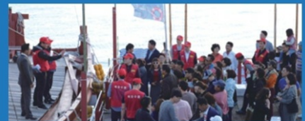
목포항 가을바다 체험을 진행하는 바지선 옆에 선박을 계류시키고 싱싱한 수산물을 경매& 즉석 기타 체험