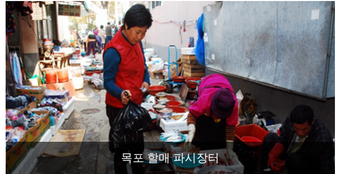
목포 할매 파시장터