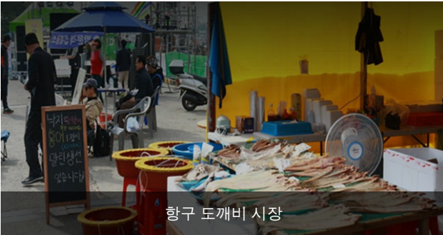
항구 도깨비 시장