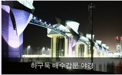
하구둑 배수갑문 야경