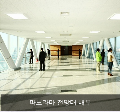
파노라마 전망대 내부