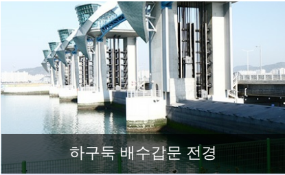
하구둑 배수갑문 전경