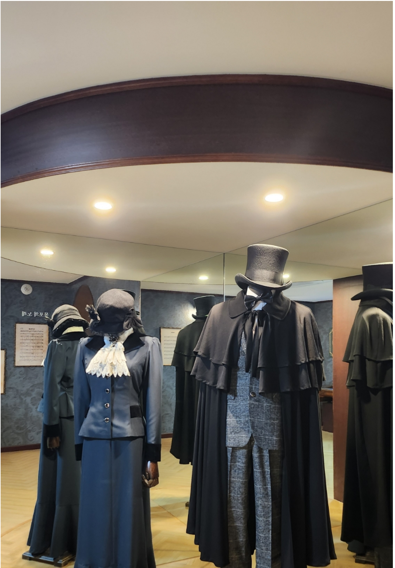
( http://www.mokpo.go.kr )