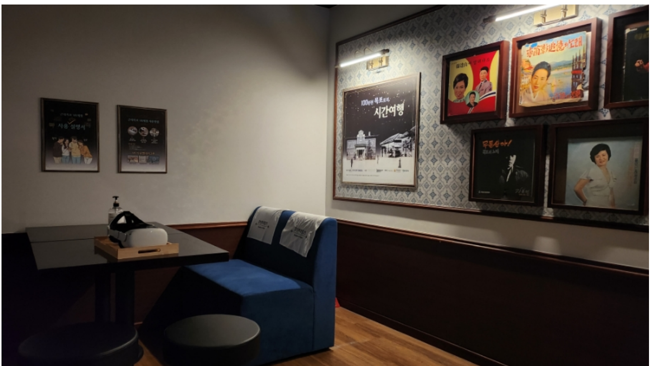
( http://www.mokpo.go.kr )