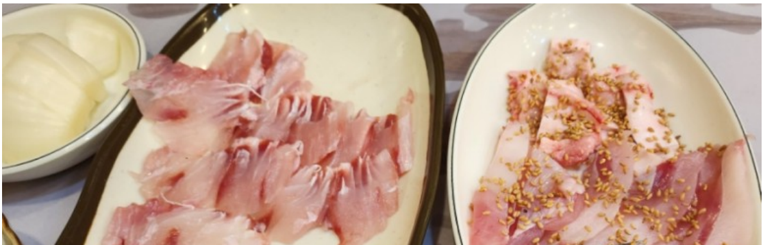
( http://www.mokpo.go.kr )