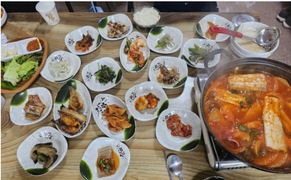
( http://www.mokpo.go.kr )