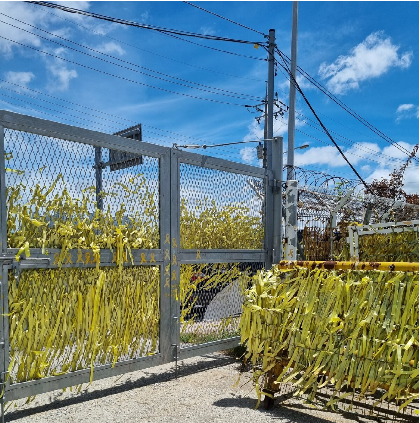
( http://www.mokpo.go.kr )