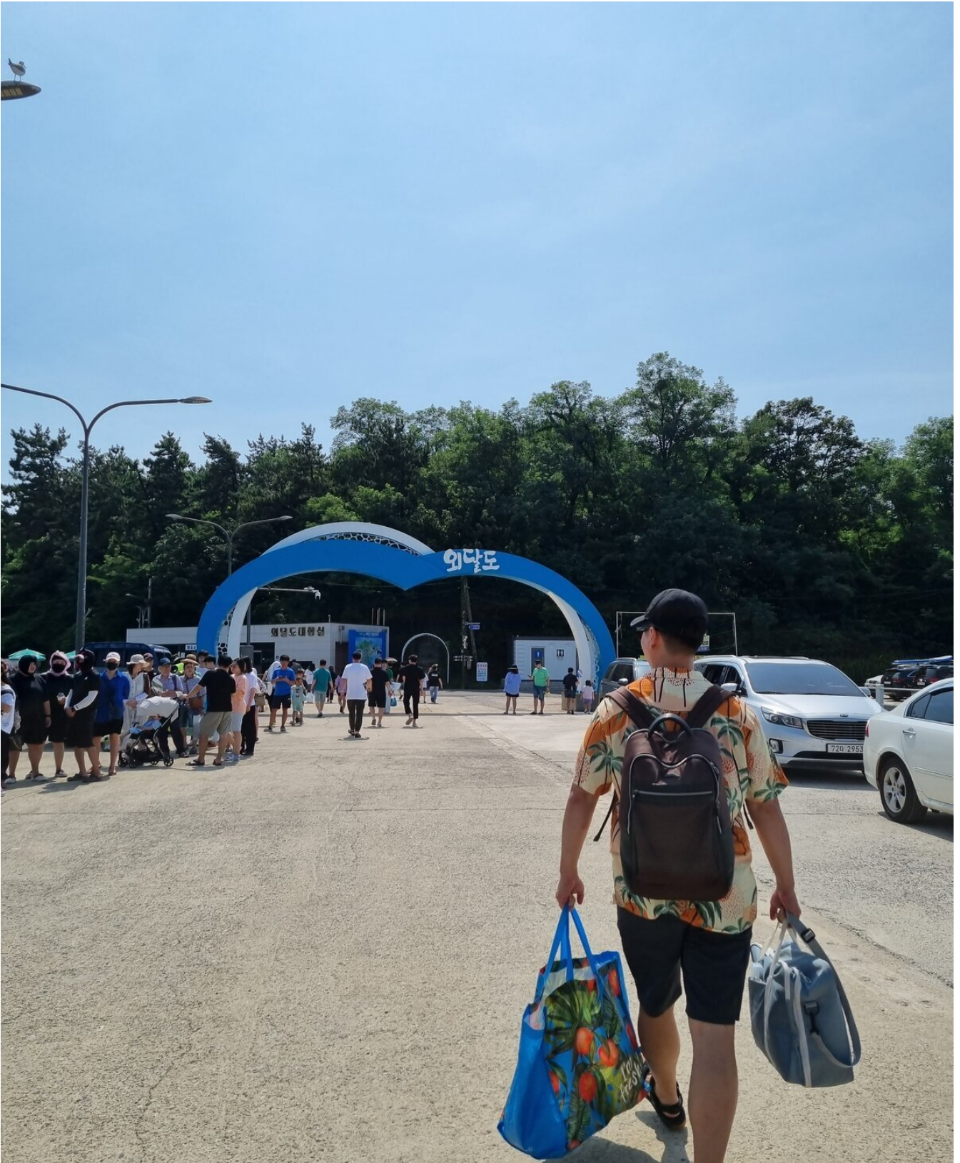
( http://www.mokpo.go.kr )