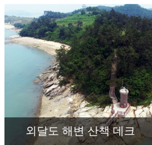
외달도 해변 산책 데크