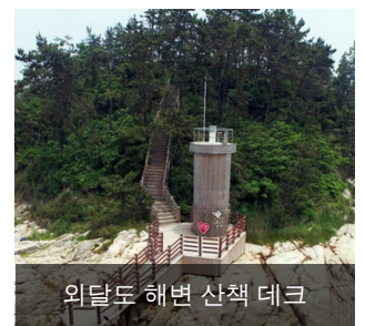
외달도 해변 산책 데크

외달도에서 가장 로맨틱한 곳으로 외달도 정상에서 바라보는 아름다운 해변가와 탁트인 바다가 보이는 가슴속까지 시원하게 해주는 사랑의 섬 하트 포토존과 해변을 따라 데크가 설치되어 아름다운 바다를 보며 걸다보면 등대에 도착해 등대가 있는 철망에 사랑의 약속인 사랑의 자물쇠도 걸어보세요~