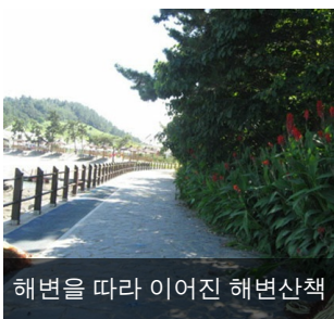
해변을 따라 이어진 해변산책

외달도 해수욕장은 총길이 260m, 폭 30m의 백사장과 푸르고 맑은 바다가 펼쳐진 장관이 아름답기로 유명하고 건너편 조그마한 별섬이 인상적인 아름다운 해수욕장입니다.