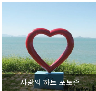
사랑의 하트 포토존