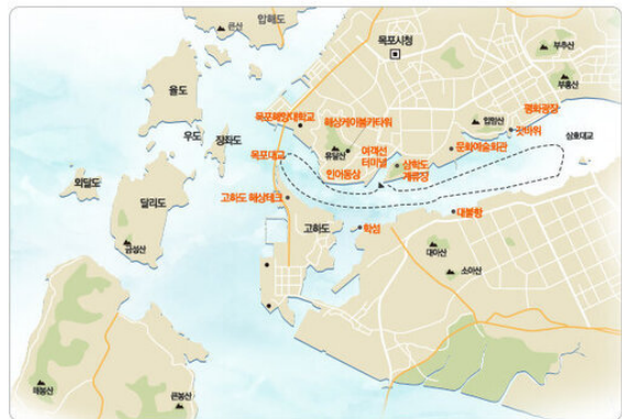
관광유람선 야간운행코스 (대형선)

삼학도 계류장 출항 → 여객선터미널 → 해상케이블카타워 → 인어동상 → 목포국립해양대학교 → 목포대교 → 고하도 용머리 → 고하도 테크 → 학섬 → 대불부두 → 평화광장 → 갯바위 → 문화예술회관 → 삼학도 계류장 입항