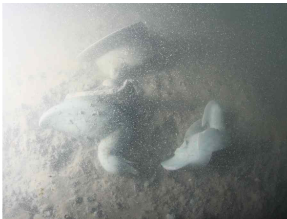
수중유적 속의 '청자 향로'