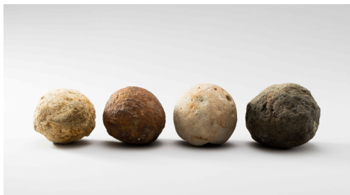
석환 石丸 | 조선, 16세기 | 지름 8.5~9.8cm 진도 명량대첩로 해저 출수