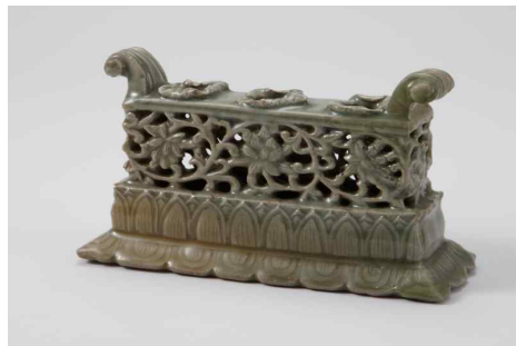
청자 연꽃 넝쿨무늬 붓꽂이 靑磁透刻蓮唐草文筆架 고려, 12세기 국립중앙박물관 소장품