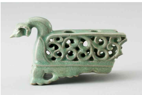
청자 넝쿨무늬 연꽃봉우리 장식 붓꽂이 靑磁透刻唐草文蓮峰形筆架 고려, 12~13세기 진도 명량대첩로 해저 출수