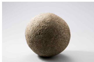
석환 石丸 조선, 16세기 | 지름 33cm 국립진주박물관 소장품