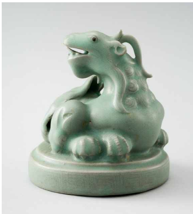
청자 기린모양 향로 뚜껑 靑磁麒麟形香爐蓋 고려, 12~13세기 | 진도 명량대첩로 해저 출수