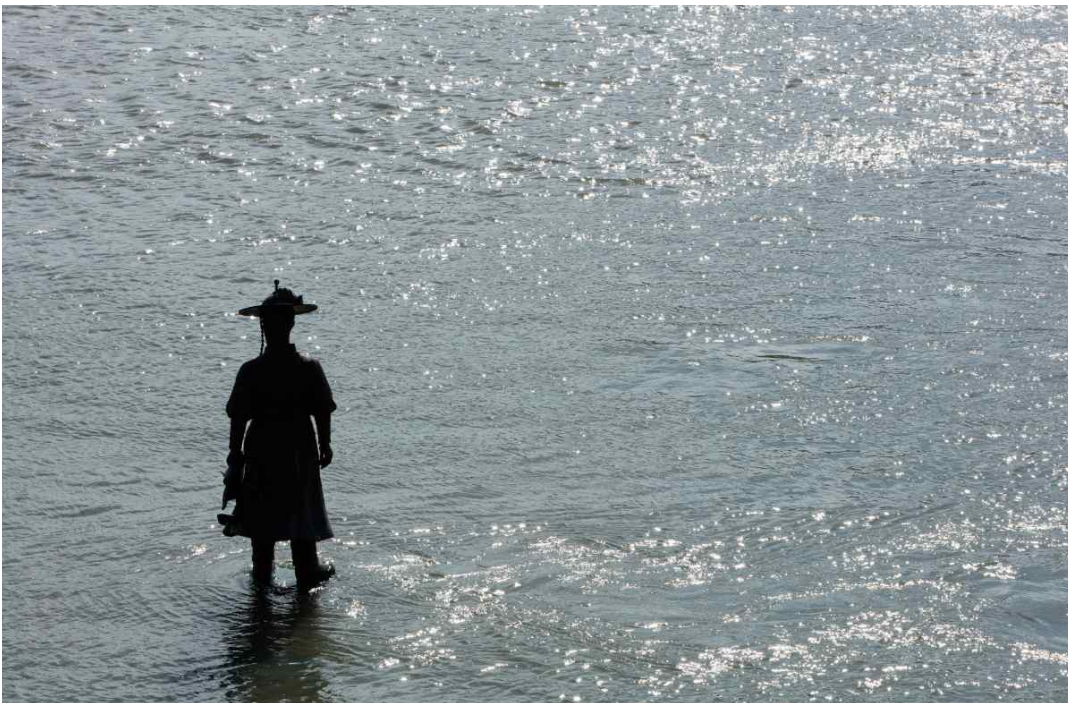
명랑해협 울돌목의 충무공 이순신 상