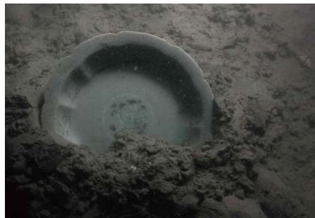
수중유적 속의 '청자 접시'