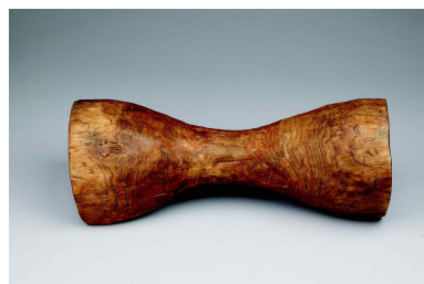
목제 요고 木製腰鼓 통일신라, 8~9세기 경기도 하남 이성산성 출토 국립중앙박물관 소장품