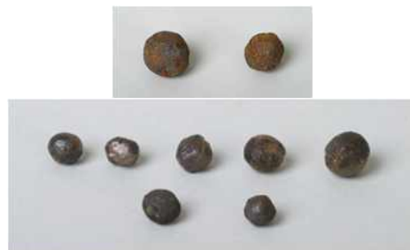
총통 철환 銃筒 鐵丸 조선, 1588년 | 지름 0.98~1.18cm 전남 여천 백도 해저 해군사관학교박물관 소장품