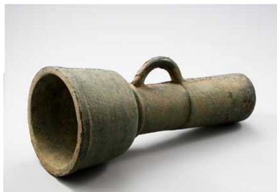
중완구 中碗口 | 조선, 1590년 | 길이 64.5cm 국립진주박물관 소장품 | 보물 제858호