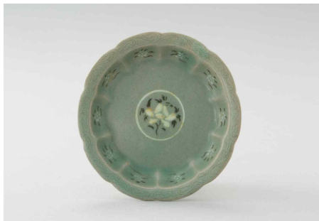
청자 모란 국화무늬 꽃모양 접시 靑磁象嵌牡丹菊花文花形楮匙 고려, 12~13세기 진도 명량대첩로 해저 출수