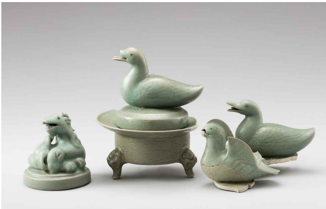
청자 향로 靑磁香爐 | 고려, 12~13세기 | 진도 명량대첩로 해저 출수