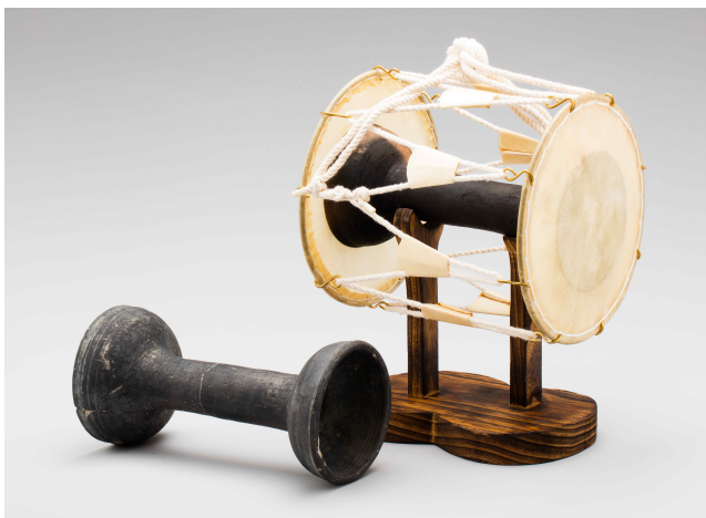
도기 요고 陶器腰鼓 | 고려 | 진도 명량대첩로 해저 출수