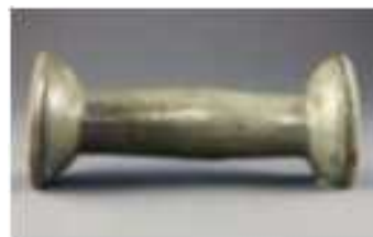
청자 요고 靑磁腰鼓 고려 | 태안 마도2호선 출수