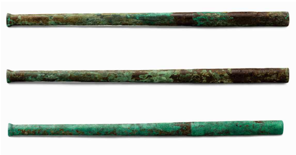
소소승자총통 小小勝字總統 | 조선, 16세기 | 길이 57.8cm 진도 명량대첩로 해저 출수