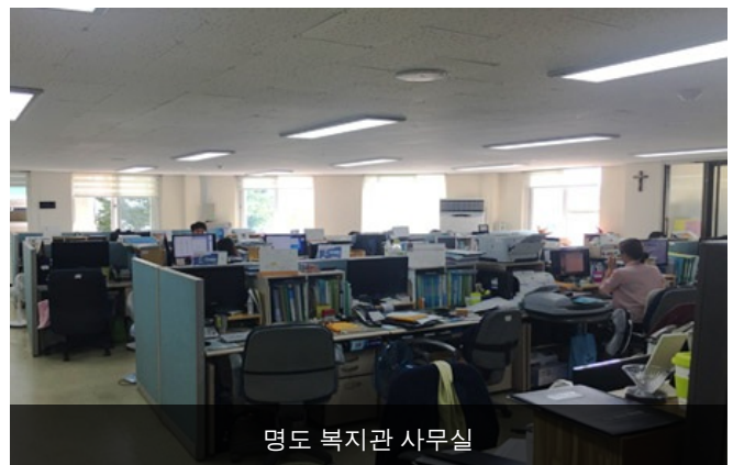
명도 복지관 사무실