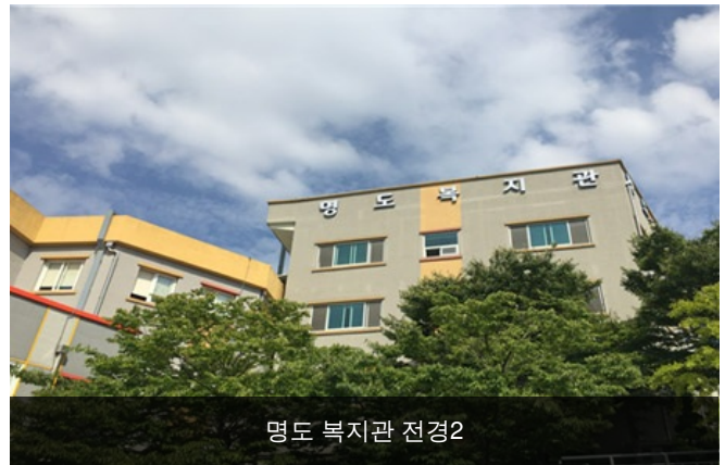
명도 복지관 전경2