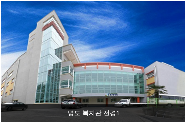
명도 복지관 전경1