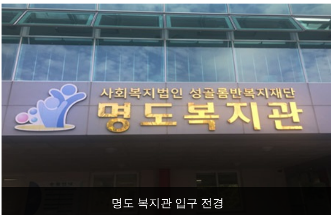
명도 복지관 입구 전경