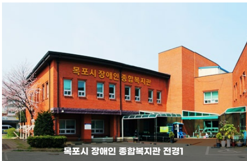
목포시 장애인 종합복지관 전경1