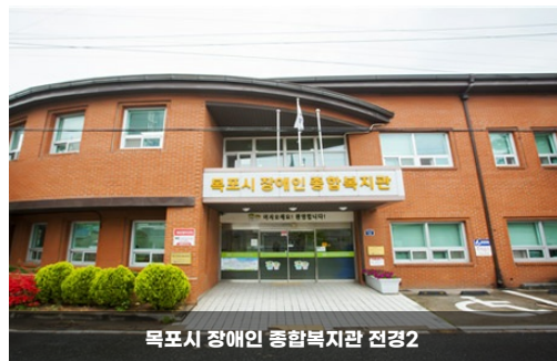
목포시 장애인 종합복지관 전경2