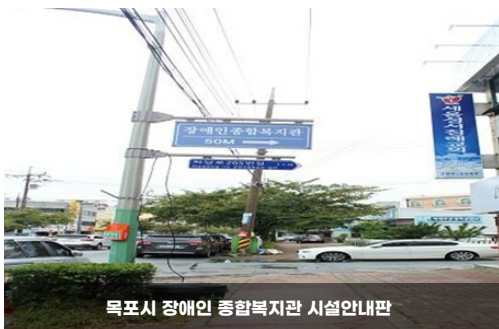
목포시 장애인 종합복지관 시설안내판