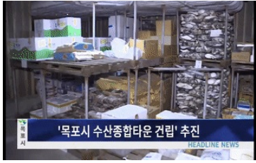
'목포시 수산종합타운 건립' 추진