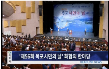
'제56회 목포시민의 날' 화합의 한마당

(헤드라인1)'목포시 수산종합타운 건립' 추진 '서남권 최대 수산물 집산지' 목포에 서남권 경제거점이 될 수산종합타운 건립이 추진되고 있습니다. 2023년 건립을 목표로 다음달 용역에 착수합니다. (헤드라인2)민선 7기 첫 시민과의 대화 민선 7기 100일을 맞은 목포시는 권역별 7곳에서 시민과의 첫 대화에 나섰습니다. 시는 이 자리에서 시장운영방향을 설명하고 시민들의 의견과 건의사항을 청취했습니다. (헤드라인3) '북항 노을공원' 지역명소 자리매김 노을이 예쁘기로 유명한 북항 노을공원이 시민들의 힐링 장소 뿐만 아니라 외지 관광객들이 오면 꼭 찾아야하는 명소로 자리매..