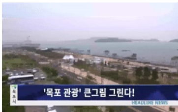
'목포 관광' 큰그림 그린다!

(헤드라인1)내년 국비 4천211억원 반영 목포시 내년도 정부 예산안이 국립호남권생물자원관 건립 등 총 88건, 4천211억원 반영됐습니다. 올해 예산안 보다 324억원이 늘어난 규모입니다. (헤드라인2)'일본 수출 시장' 개척 목포시 출연기관인 목포수산물지원센터가 전남생물산업진흥원 해양바이오연구센터와 함께 일본에 김 가공품 900만 달러 수출입 지원에 협약하는 등 일본 시장을 개척해 관심을 모으고 있습니다. (헤드라인3)'2018전남국제수목비엔날레'10월31일까지 '2018 전남 국제수목비엔날레'가 목포와 진도에서 61일 간의 대장정에 들어갔습니다. 수목을 통해 남도 문화에..