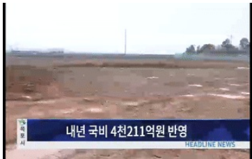
내년 국비 4천211억원 반영

(헤드라인1)목포시 기업유치단 구성·운영 목포시가 지역경제 활로를 모색하기 위해 기업인과 경제단체, 전문가 등이 참여하는 기업유치단을 출범하고 기업유치 총력전에 나섰습니다. (헤드라인2) 2018목포항구축제 10월5일~7일 2018목포항구축제가 바다 위에 어시장 '신명나는 파시장터'를 주제로 10월5일부터 7일까지 목포항과 삼학도 일원에서 개최됩니다. (헤드라인3) "목포야행 인파 북적" 목포 원도심의 역사문화자원을 활용해 야간형 문화향유 프로그램인 목포야행이 올해 처음으로 열렸습니다. 평소 저녁이 되면 한산했던 원도심에 목포야행으로 많은 인파가 몰리면서 목포 도심의 브랜드 가..