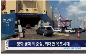
평화 경제의 중심, 위대한 목포시대

(헤드라인1)'목포 관광' 큰그림 그린다! 목포시가 천만 관광객 시대를 열어갈 관광중합발전계획의 핵심전략을 수립해 2027년까지 북항권 등 권역별 다양한 관광사업을 추진합니다. (헤드라인2)제18회 세계마당페스티벌(8월31일~9월2일) 해외 7개국 초청, 국내 40여 작품을 선보이는 제18회 목포세계마당페스티벌이 8월 31일부터 9월 2일까지 유달 예술타운과 목포일대에서 개최됩니다. (헤드라인3) 목포시 작가들의 '수목' 향연 목포에서 8월31일 개막식을 시작으로 2018전남국제수목비엔날레가 열립니다. 이에앞서 사전 특별프로그램으로 열린 '국제적 수목수다방'이 큰 ..