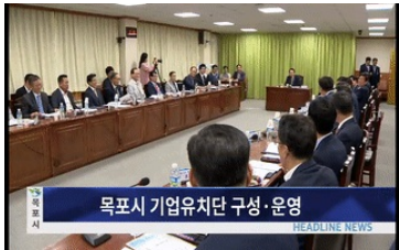
목포시 기업유치단 구성·운영

(헤드라인1)'제56회 목포시민의 날' 화합의 한마당 지난 10월1일 열린 제56회 목포 시민의 날이 목포의 힘찬 도약을 기원하는 화합과 소통의 한마당으로 개최됐습니다. (헤드라인2) 목포시 CCTV통합관제센터, 24시간 안전지킴이 지난해 2월 개소한 목포시 CCTV통합관제센터가 추석 연휴에도 변함없이 관제요원과 경찰이 4조 3교대로 24시간 동안 모니터링해 특별한 사건·사고 없는 안전한 추석에 기여했습니다. 시민들의 24시간 안전지킴이가 되고 있습니다. (헤드라인3)[생활백서]추석의 파시 '2018 목포항구축제' 개항 120년이 넘는 역사를 지닌 목포항 일원에서 2018 목포항구축제가..