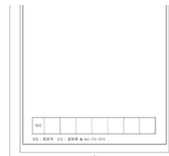
목포시보 제1500호 미리보기 다운로드