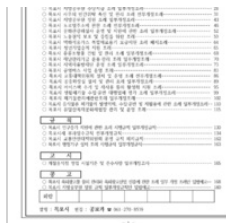
목포시보 제1501호 미리보기 다운로드