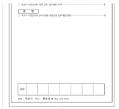
목포시보 제1503호 미리보기 다운로드