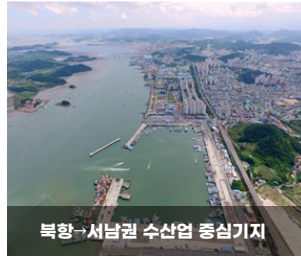
북항→서남권 수산업 중심기지