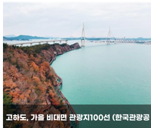
고하도, 가을 비대면 관광지100선 (한국관광공)