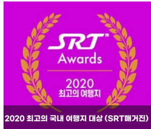
2020 최고의 국내 여행지 대상 (SRT패거진)